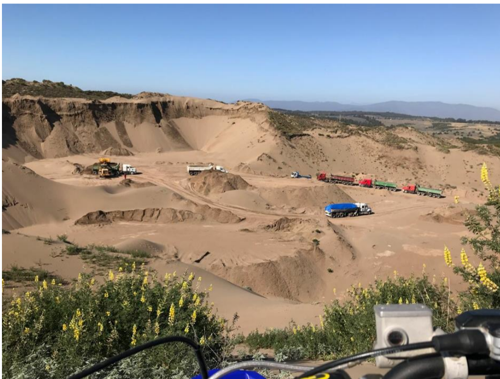
Imagen 4. Sector de extracción de áridos en parcela N° 13, donde se puede observar una faena de extracción y carguío de arena con 7 camiones. Fecha de la imagen: 06/12/2017.