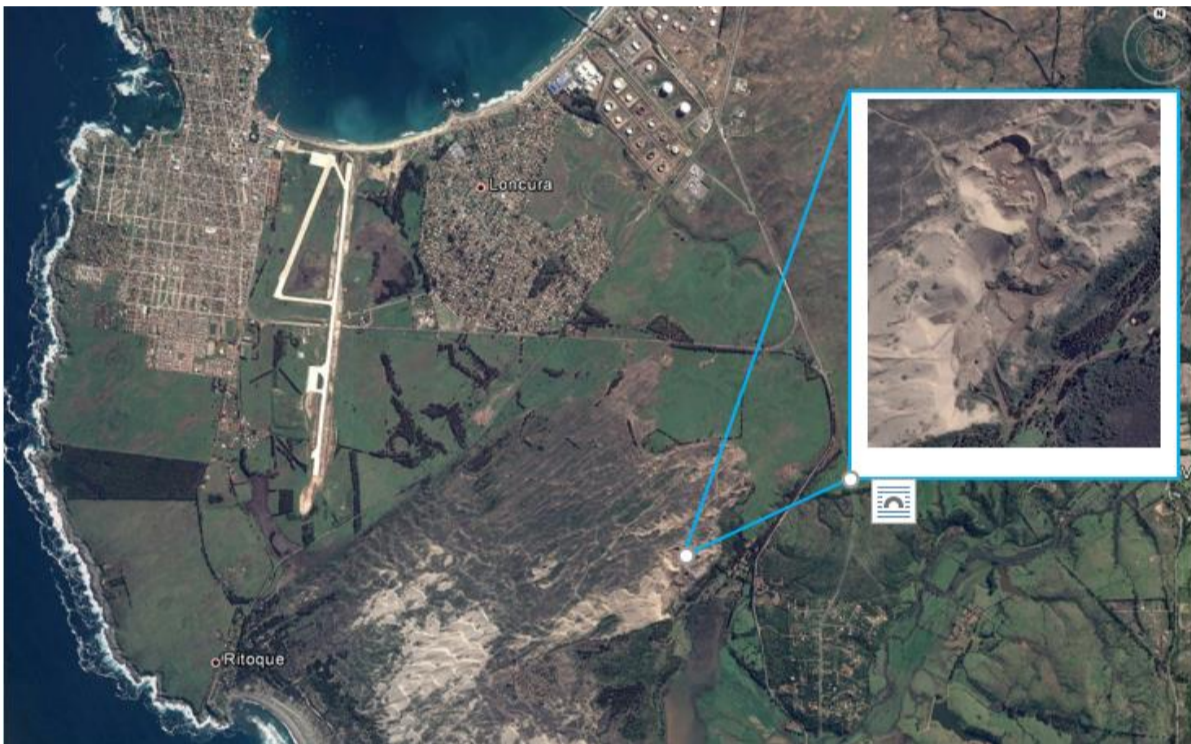
Imagen 2. Vista aérea de las dunas de Ritoque, su entorno y la Unidad Fiscalizable

11. Motivado por la denuncia previamente indicada, con fecha 6 de diciembre de 2017, la SMA realizó una inspección ambiental a la unidad fiscalizable Áridos Santa Angela, en el Km 13 de la Ruta F-30-E, en la comuna de Quintero, Región de Valparaíso.