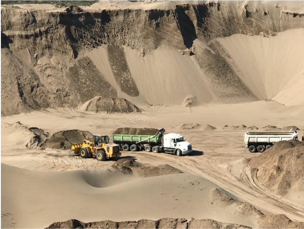
Imagen 3. Sector de extracción de áridos en la parcela N°13, donde se puede observar faena de carguío de arena y taludes sin contención. Fecha de la imagen 06/12/2017.