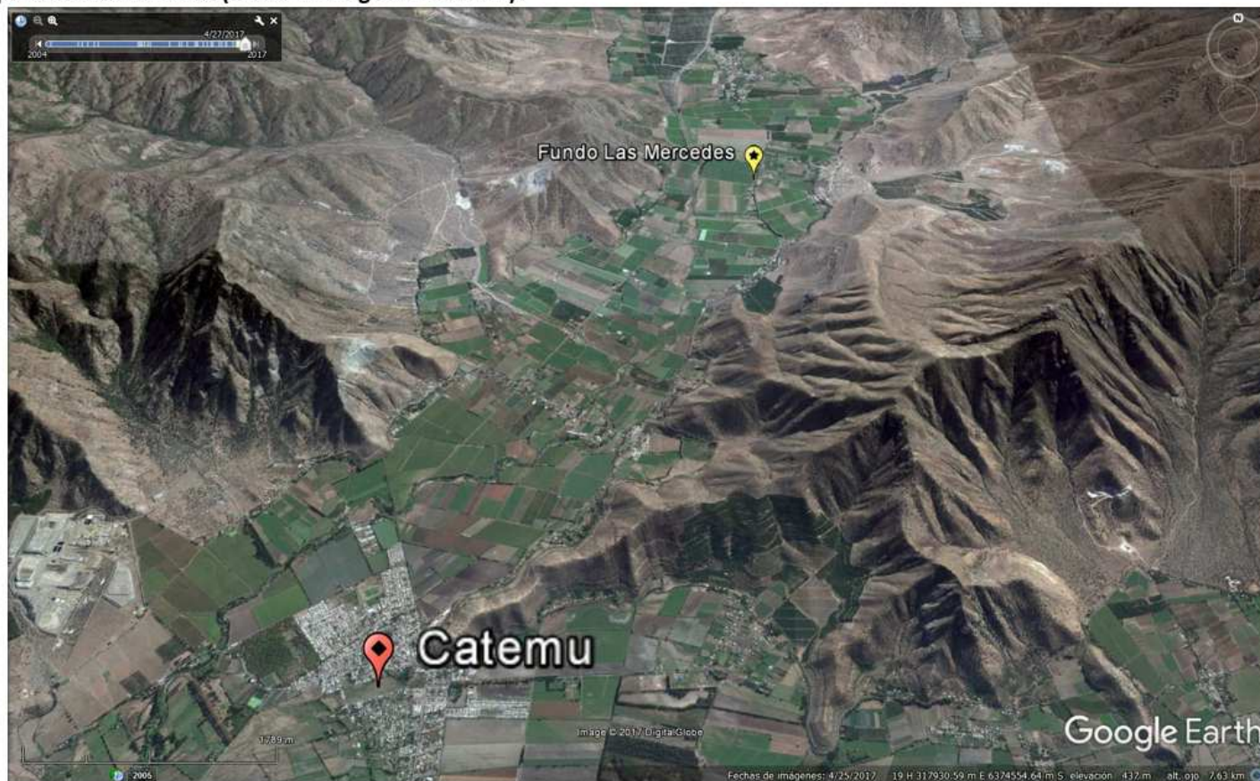
Figura 1. Mapa de ubicación local (Fuente: Google Earth 2016).