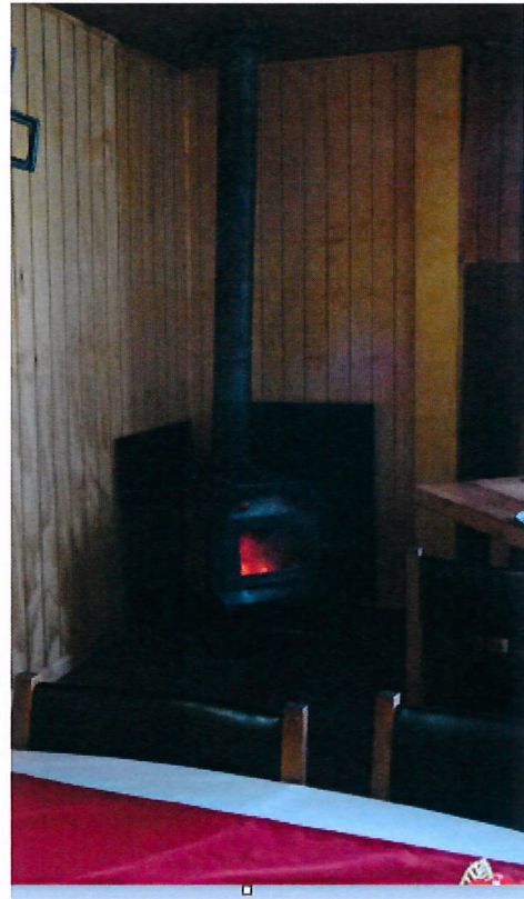
Fotografía 2 y 3