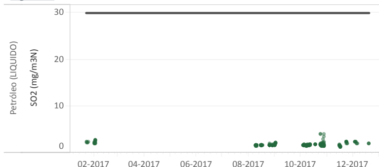
Figura Nº2 - Resumen horas reportadas para Dióxido de Azufre (SO 2 ) - Año 2017