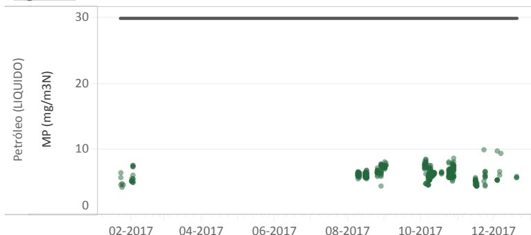
Figura Nº1 - Resumen horas reportadas para Material Particulado (MP) - Año 2017