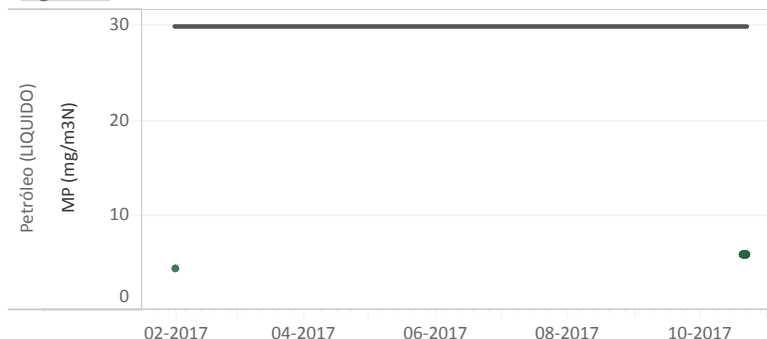
Figura Nº1 - Resumen horas reportadas para Material Particulado (MP) - Año 2017