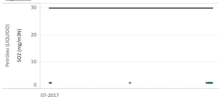
Figura Nº2 - Resumen horas reportadas para Dióxido de Azufre (SO 2 ) - Año 2017