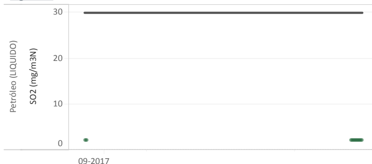
Figura Nº2 - Resumen horas reportadas para Dióxido de Azufre (SO 2 ) - Año 2017