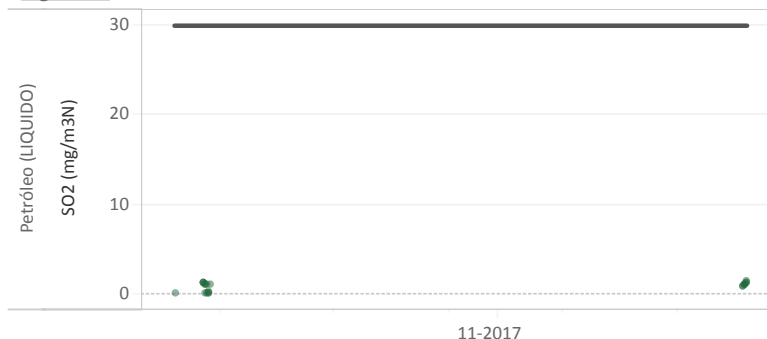
Figura Nº2 - Resumen horas reportadas para Dióxido de Azufre (SO 2 ) - Año 2017