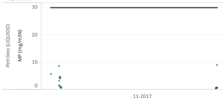
Figura Nº1 - Resumen horas reportadas para Material Particulado (MP) - Año 2017