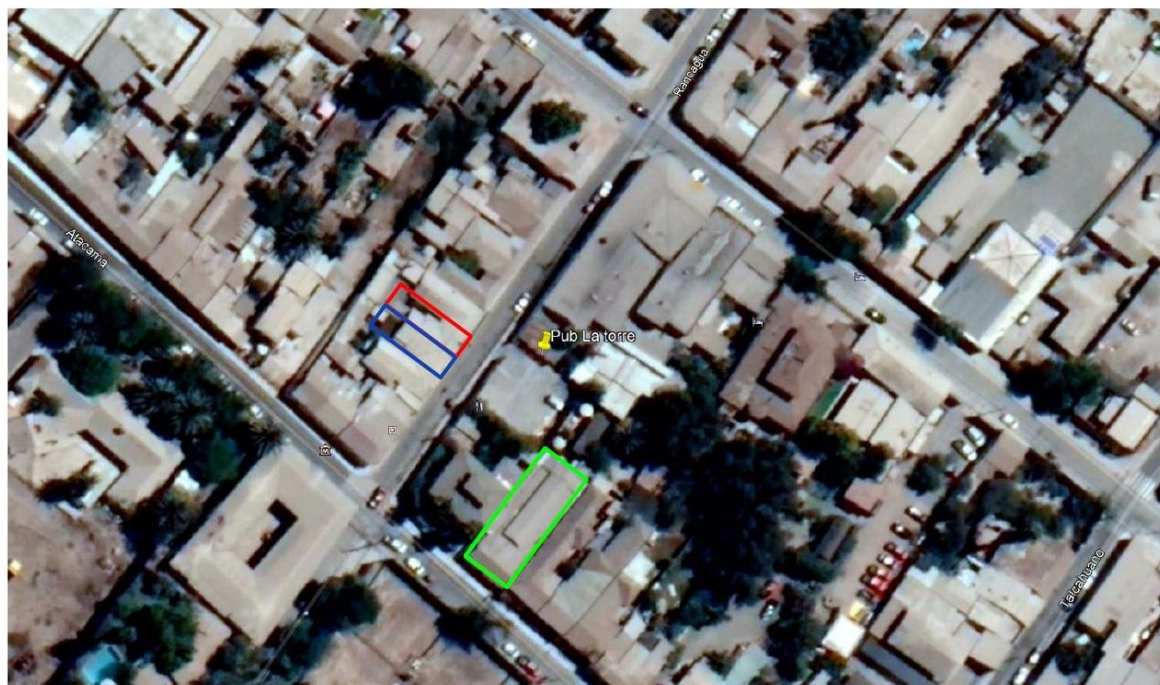
Figura 1. Mapa de ubicación local de denunciante y fuentes emisoras denunciadas (Fuente: Elaboración propia en base a Google Earth Pro).

En verde: Pub Dunas En Rojo: Restaurant Pin Up En Azul: Vivienda de Denunciante 📌 : Ubicación Pub La Torre