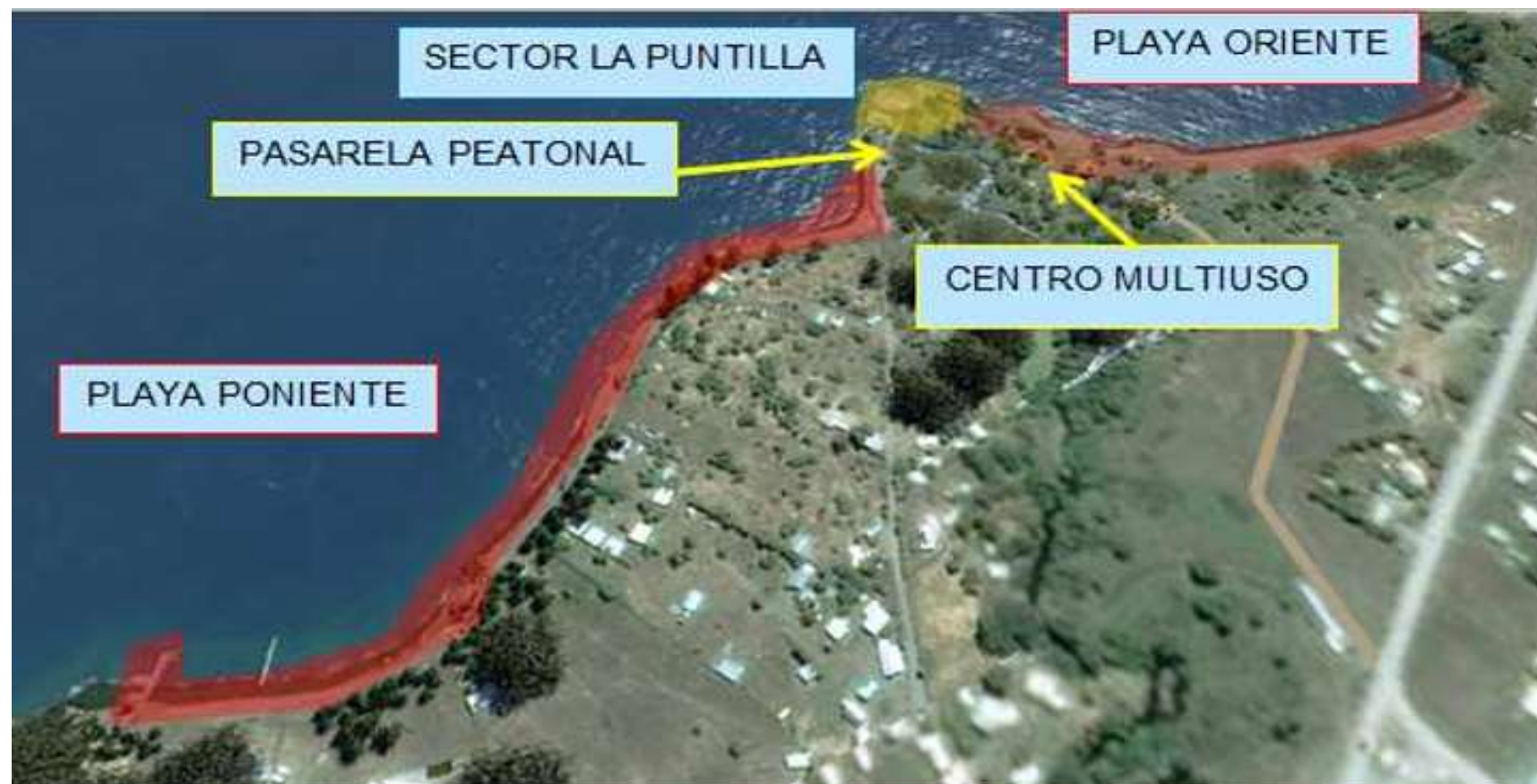
Fotografía 1: Vista referencial de lugar emplazamiento proyecto