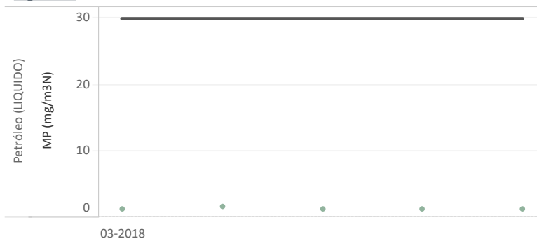
Figura Nº1 - Resumen horas reportadas para Material Particulado (MP) - Año 2018