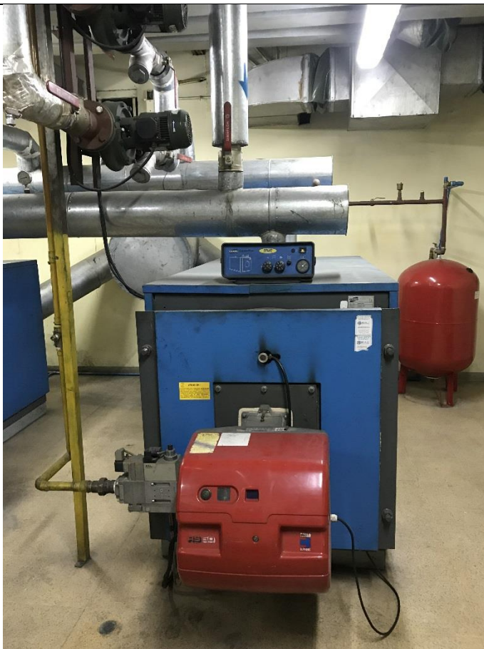
Fotografía N°1 Fecha: 23.04.2019