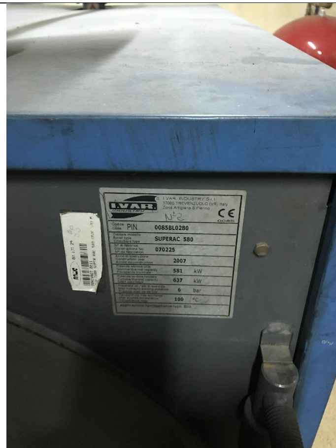
Fotografía N°2 Fecha: 23.04.2019