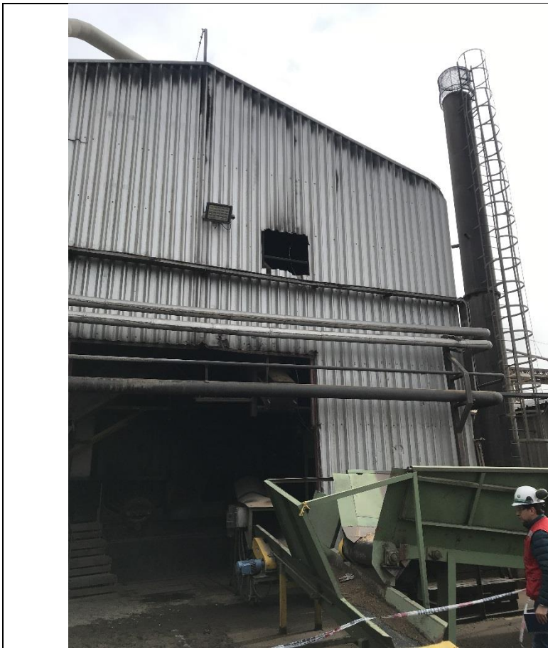
Fotografía N°1 Fecha: 14.06.2019