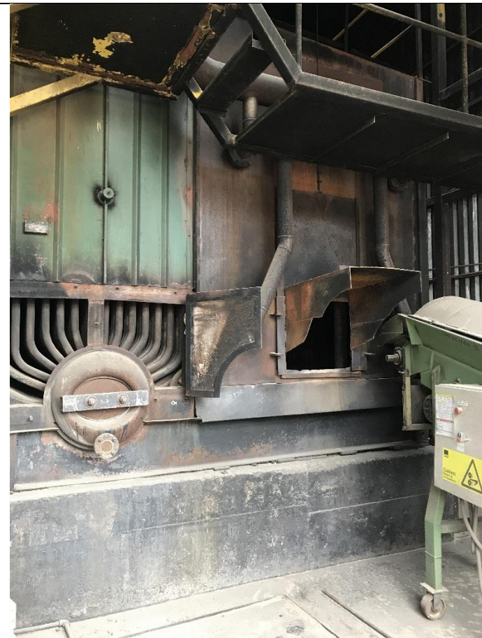
Fotografía N°2 Fecha: 14.06.2019

Descripción: Caldera SS BIO-86, la cual se encuentra detenida y dada de baja.