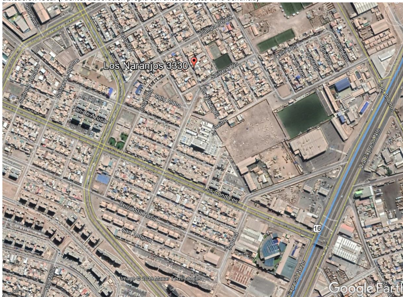
Figura 1. Mapa de ubicación local

Coordenadas UTM de referencia: DATUM WGS 84