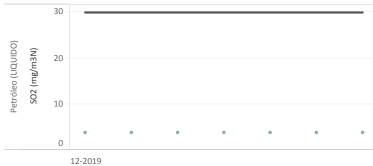
Figura Nº2 - Resumen horas reportadas para Dióxido de Azufre (SO 2 ) - Año 2019

Datos de SO 2 medidos durante las horas de régimen :