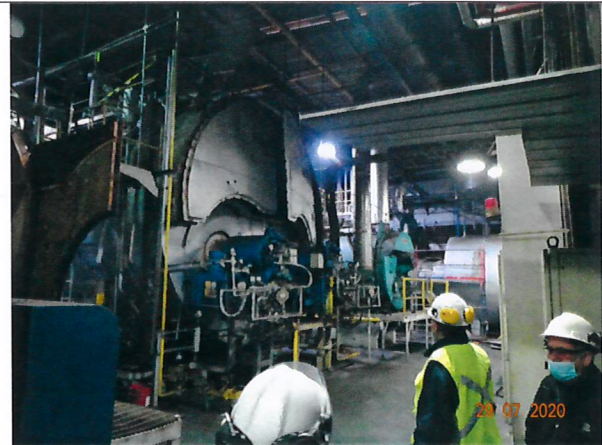
Fotografía 2: calderas apagadas.

Se termina la actividad de fiscalización a las 18:25 horas. El acta de Inspección se realizará en Oficina Regional Biobío, debido a contingencia nacional COVID-19.