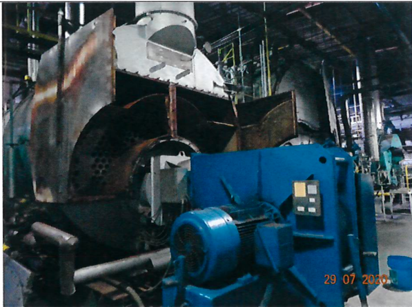
Fotografía 1: Caldera en mantención

A continuación, se presentan fotografías de la inspección: