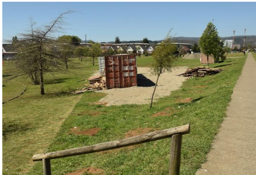
Fotografía 1. 16-10.2020.

Descripción del medio de prueba: Contenedores para la instalación de faenas.