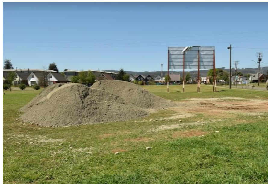
Fotografía 2. 16.10.2020.

Descripción del medio de prueba: Contenedores para la instalación de faenas.