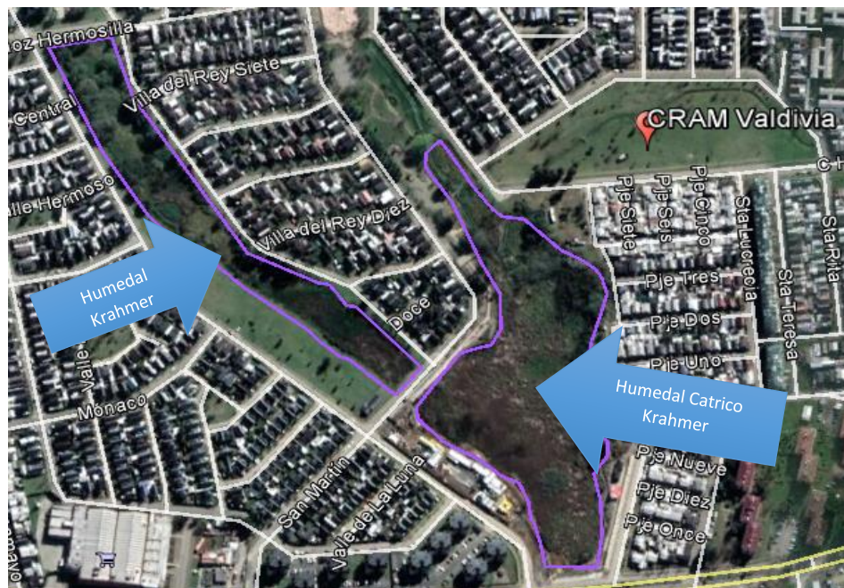
Figura 5: Describe la ubicación del Centro Recreativo del Adulto Mayor, respecto de los humedales urbanos Krahmer y Catrico Krahmer (ambos delimitados en línea de color morado).

La Figura 5 muestra que, efectivamente el paño donde se construirá el citado proyecto, se encuentra fuera de los límites de los humedales urbanos Krahmer y Catrico Krahmer.