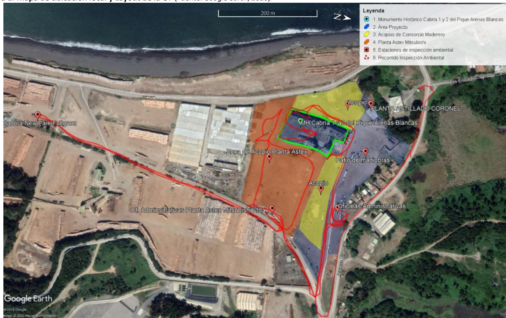
Figura 1. Mapa de ubicación local y Layout de la UF.

Coordenadas UTM de referencia: DATUM WGS 84