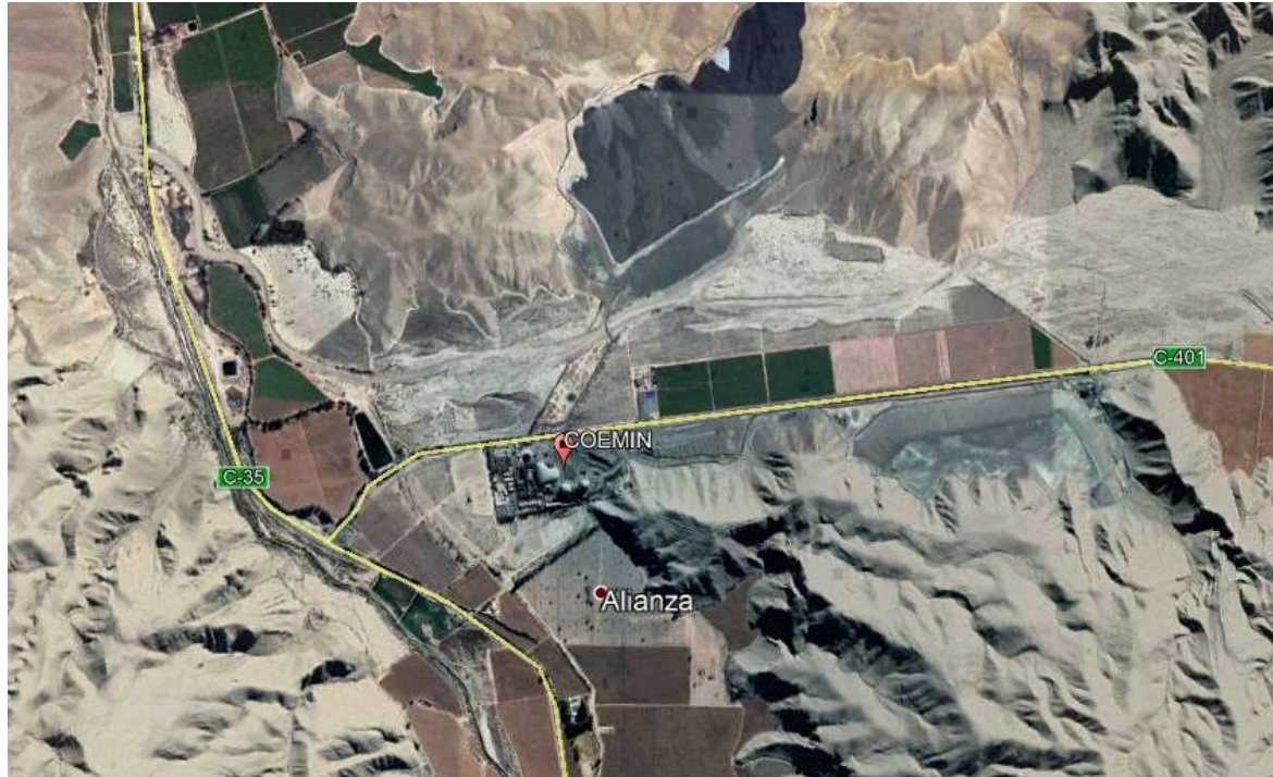
Figura 1. Mapa de ubicación local

Coordenadas UTM de referencia: DATUM WGS 84