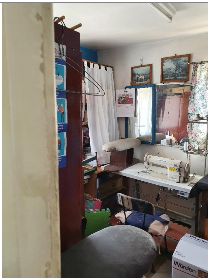
Figura 1. Registro máquina de coser en desuso.