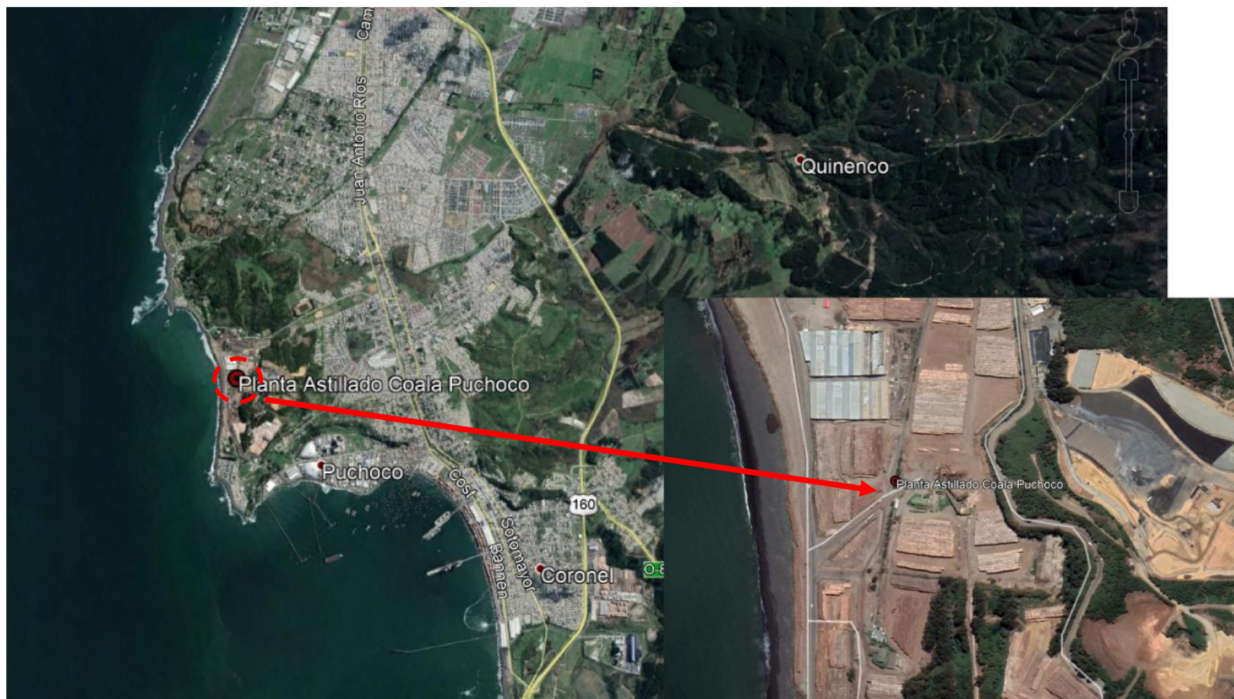
Figura 1. Mapa de ubicación local (Fuente: Google Earth).

Coordenadas UTM de referencia: DATUM WGS 84