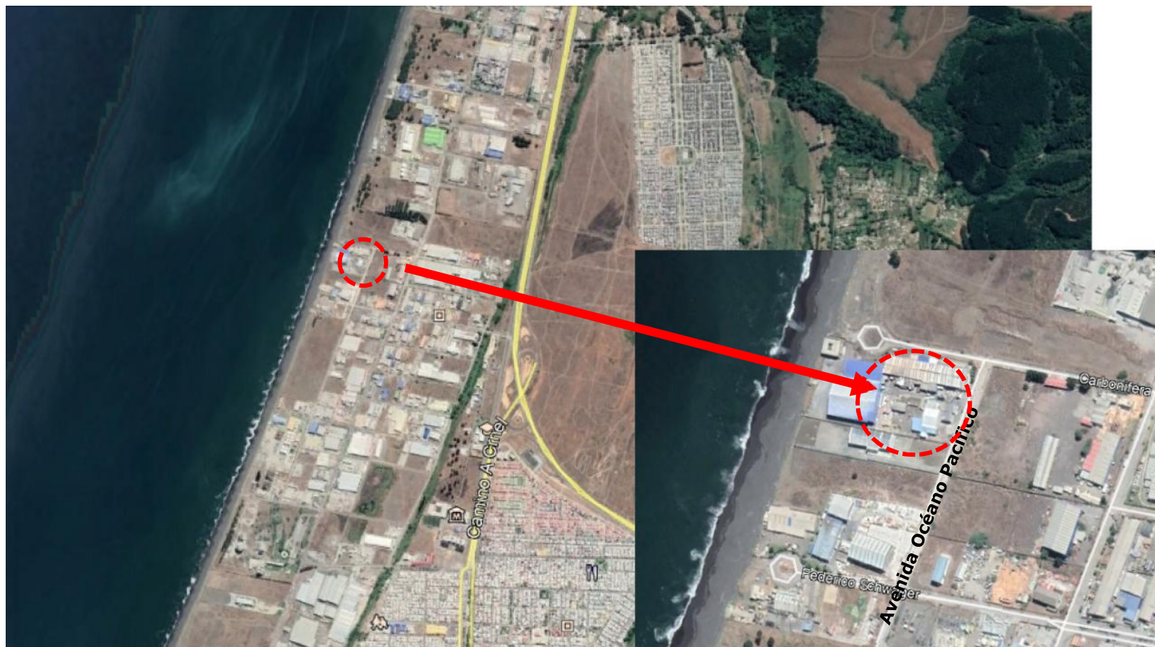
Figura 1. Mapa de ubicación local.

Coordenadas UTM de referencia Alimentos Mar Profundo