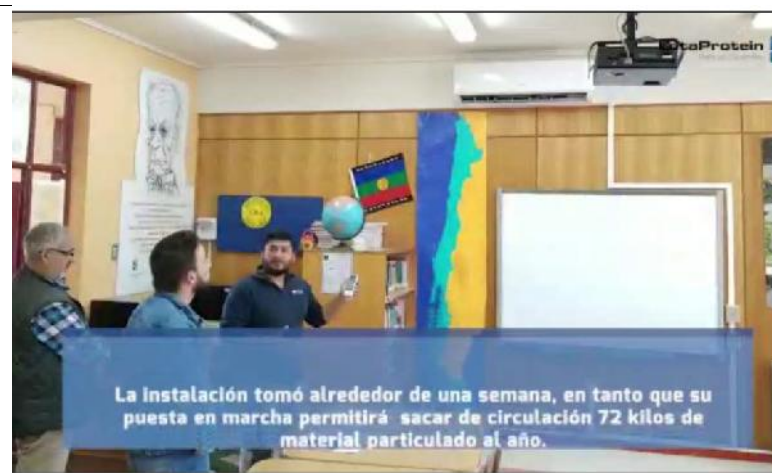
Fotografía N°8 Fecha: 08.04.2020

Descripción: Equipo de aire acondicionado instalado en la sala de enlace.