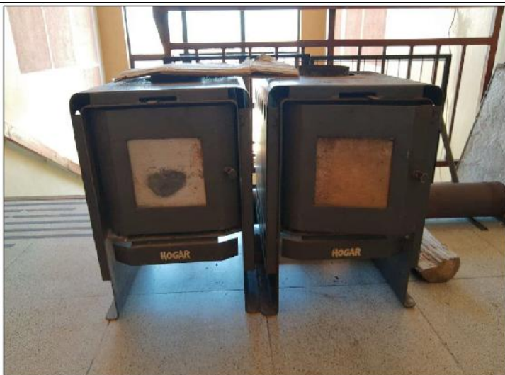
Fotografía N°5 Fecha: 08.04.2020