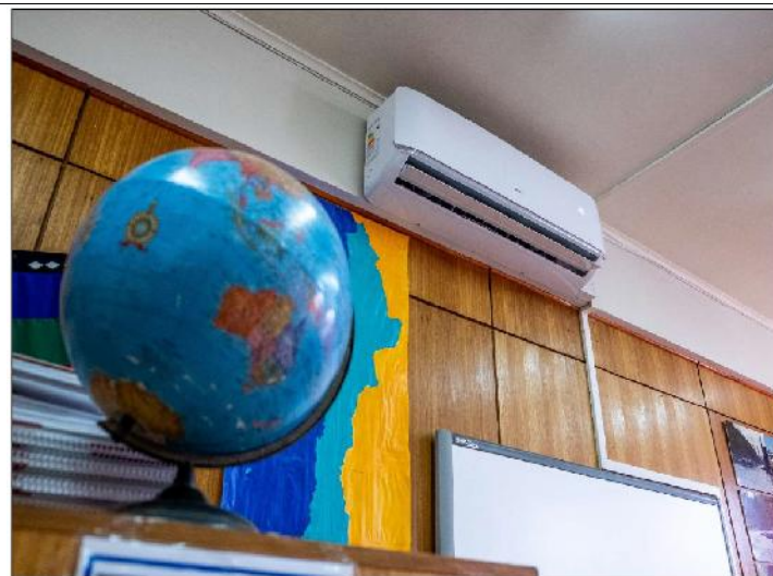
Fotografía N°6 Fecha: 08.04.2020

Descripción: Equipo de aire acondicionado instalado en la biblioteca.