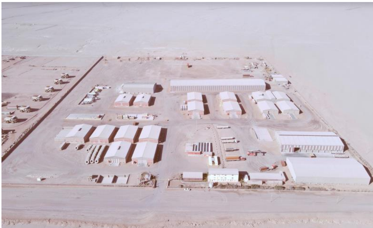
Figura 2. Imagen frontal del proyecto (Fuente: Sercabol Ltda, Anexo a Carta sin número del 31 de julio de 2020).