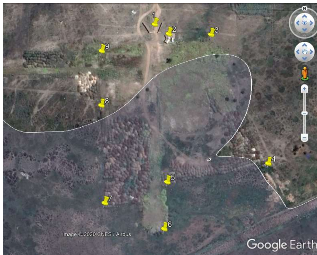
Figura 3 Esquema del Recorrido (Fuente: Imagen de fondo obtenida en Google Earth, delimitación del humedal provista por el SEREMI MMA de la RM).