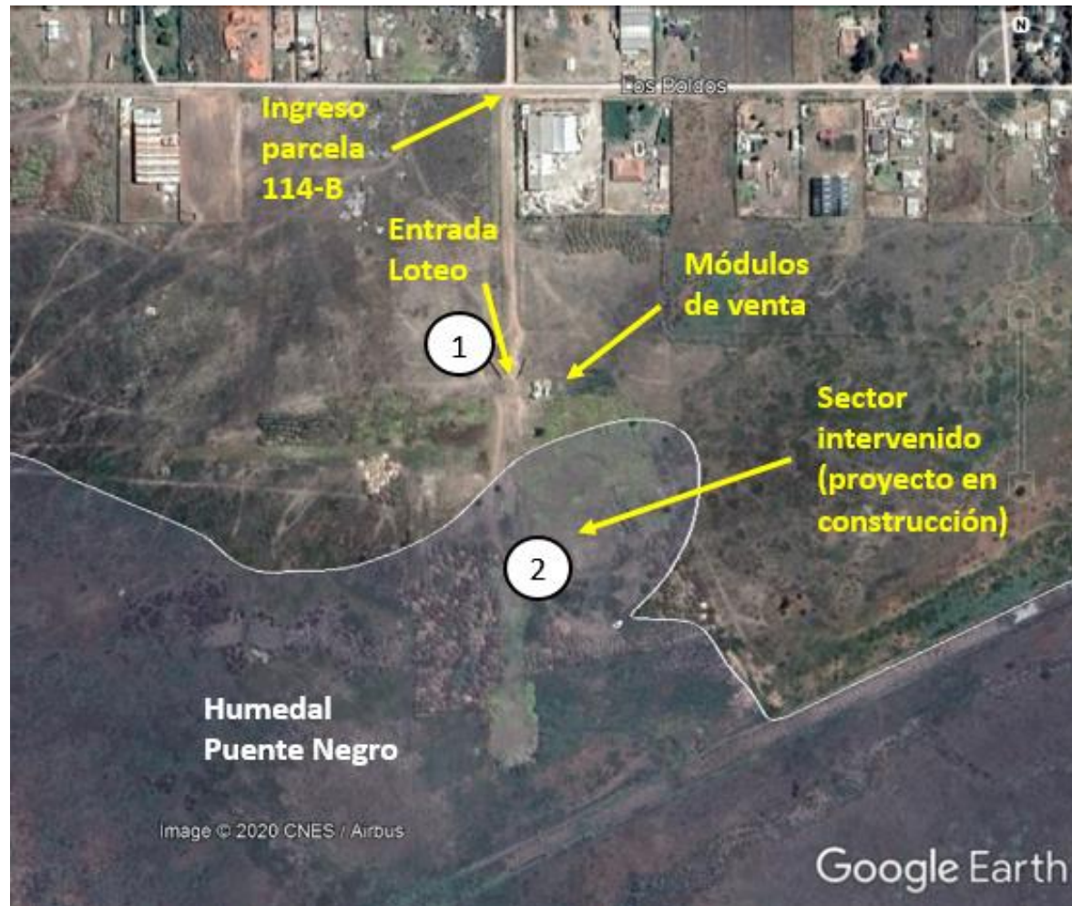
Figura 3 Esquema del Recorrido.