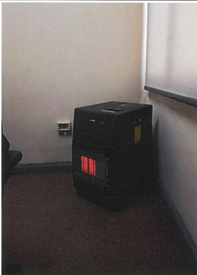
Estufa a gas 5