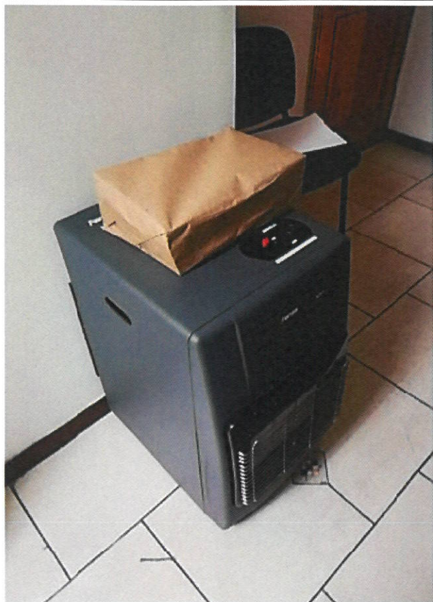
Estufa a gas 1