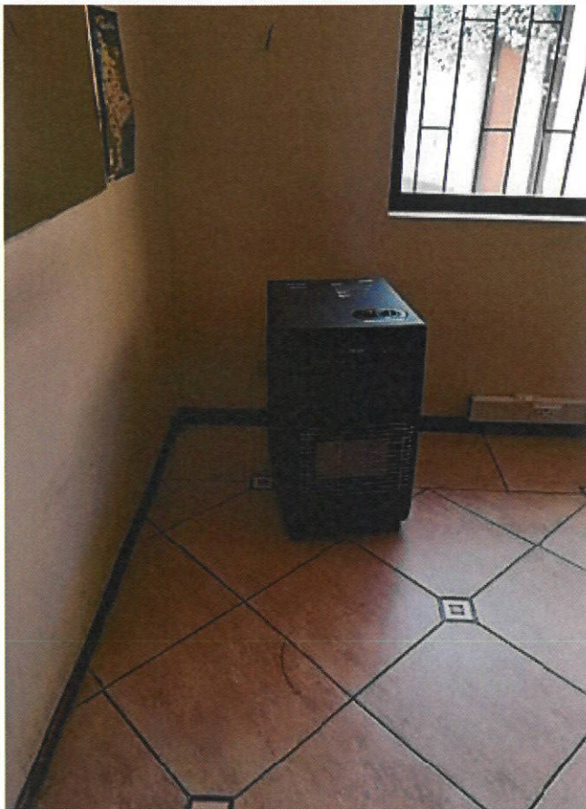
Estufa a gas 3