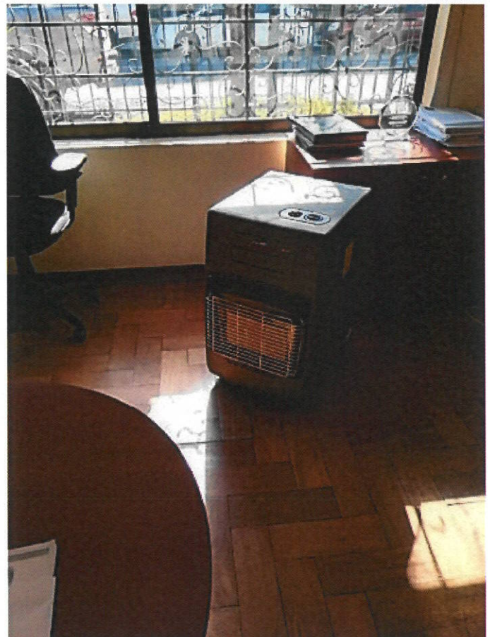
Estufa a gas 4