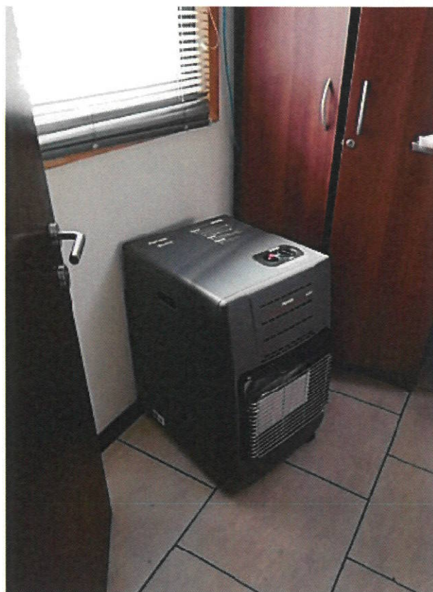
Estufa a gas 2