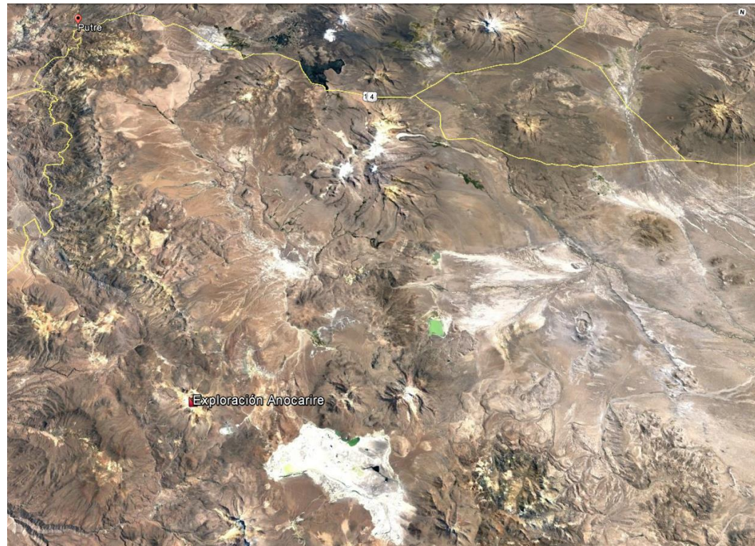
Figura 1. Mapa de ubicación local.

Coordenadas UTM de referencia: DATUM WGS 84