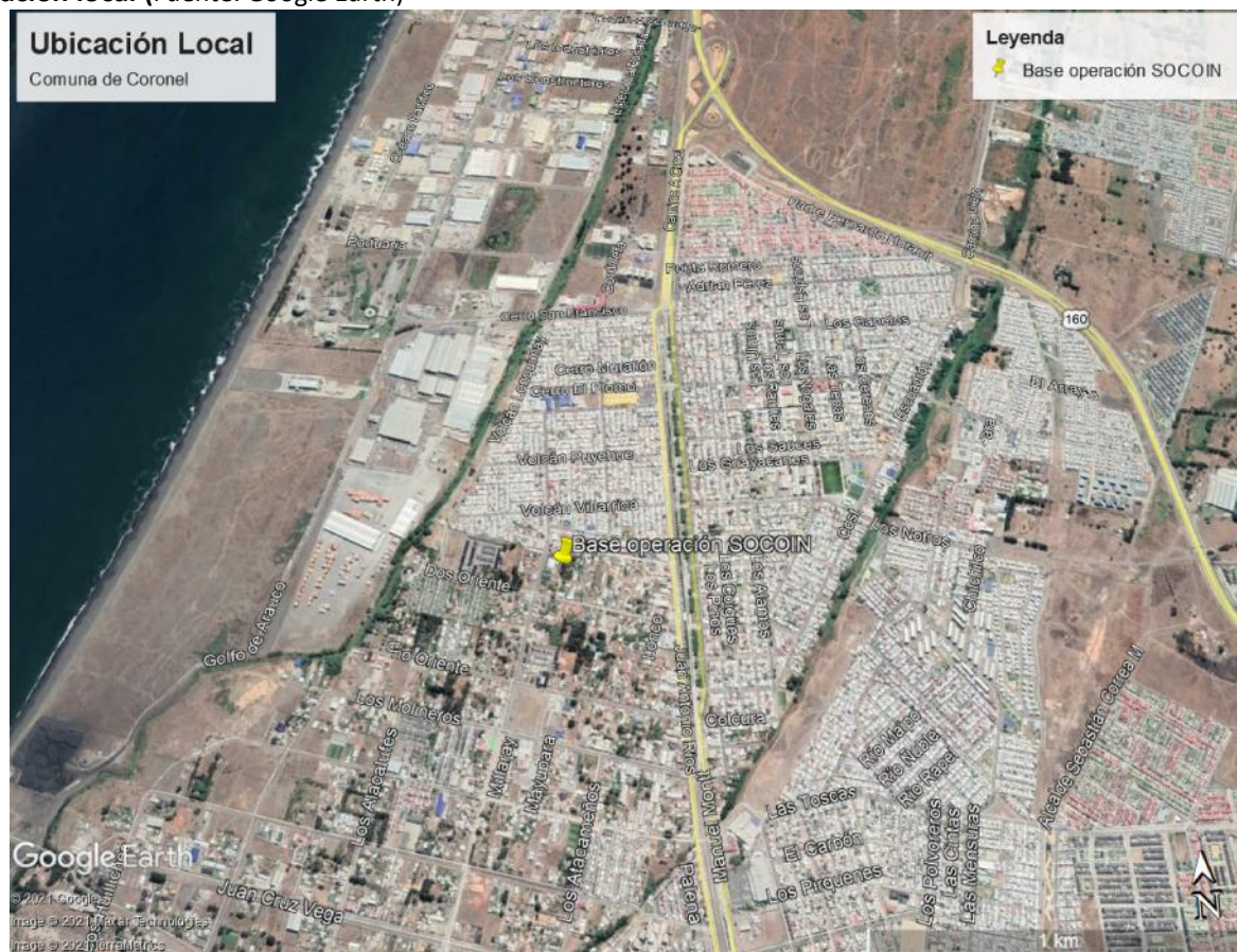
Figura 1. Mapa de ubicación local

Coordenadas UTM de referencia: DATUM WGS 84