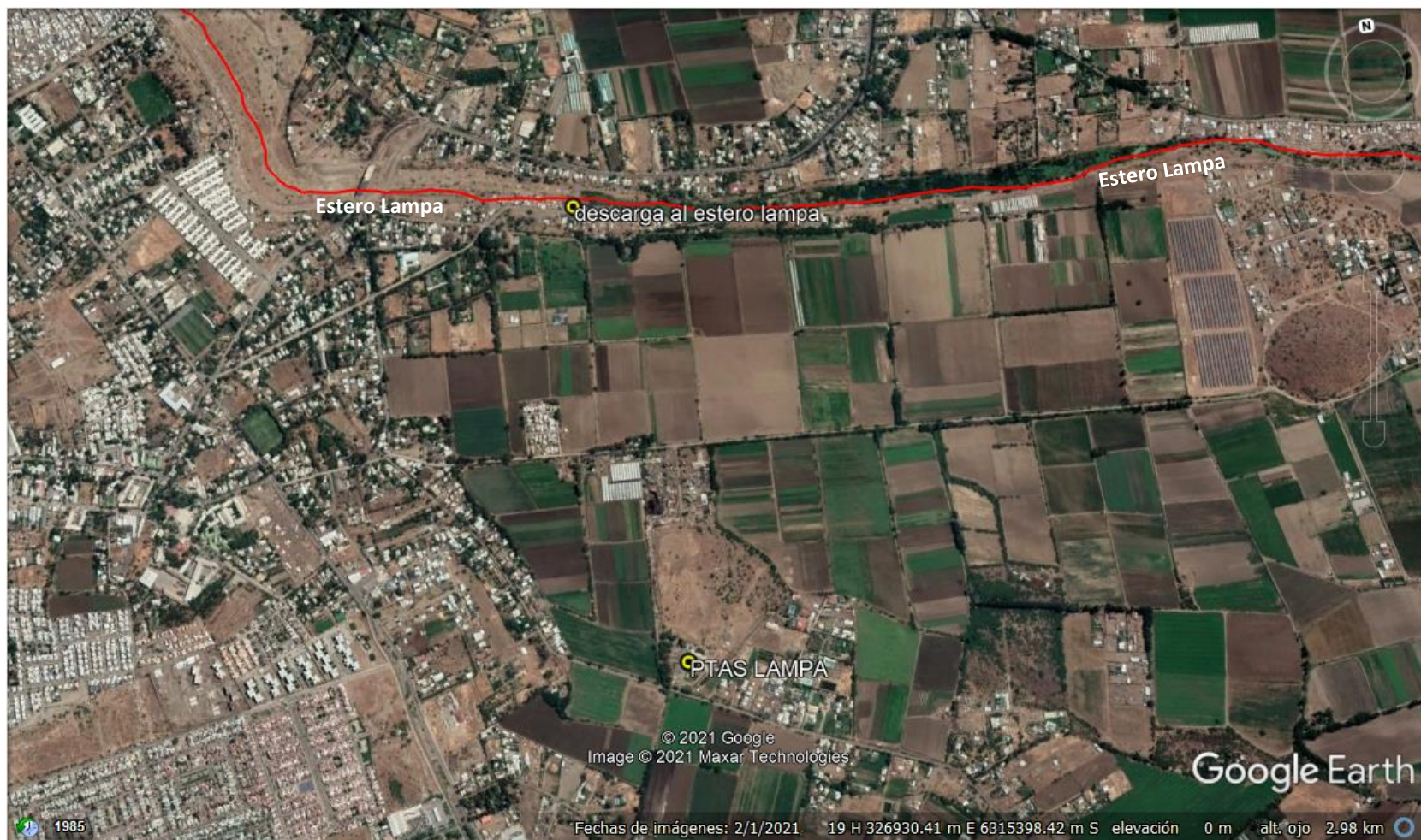
Figura 2. Mapa de ubicación local.