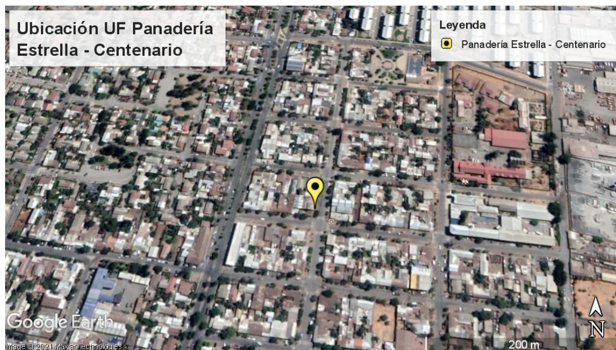
Figura 1. Ubicación Panadería Estrella - Centenario, en Centenario #341, comuna de Rancagua, en inspección ambiental del día 25 de junio del 2021.