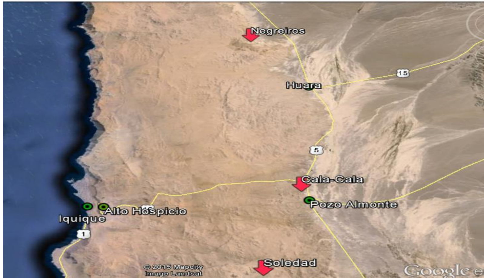
Figura 1. Mapa de ubicación local