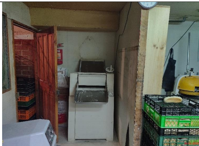
Fotografía 6. Fecha: 04-11-2020

Descripción del medio de prueba: Fotografía de la reubicación de equipos y maquinarias al interior de la panadería, alejado de receptor sensible.