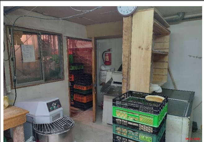
Fotografía 7. Fecha: 04.11.2020

Descripción del medio de prueba: Fotografía de la reubicación de equipos y maquinarias al interior de la panadería, alejado de receptor sensible.