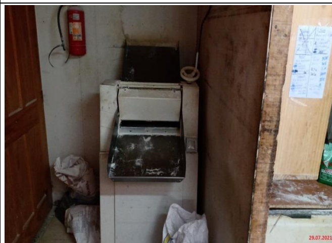
Fotografía 5. Fecha: 29-07-2021

Descripción del medio de prueba: Fotografía de la reubicación de equipos y maquinarias al interior de la panadería, alejado de receptor sensible.