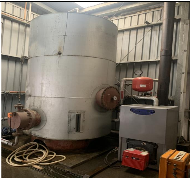
Fotografía 1: Caldera de calefacción.