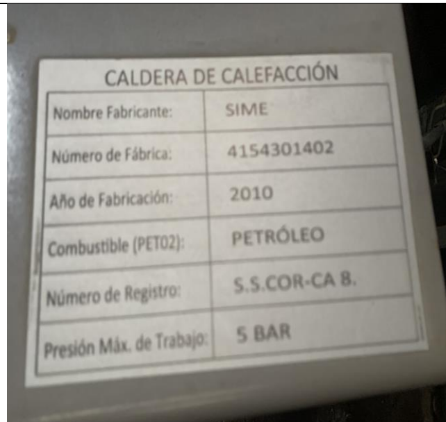
Fotografía 2: Placa identificadora Caldera de calefacción.