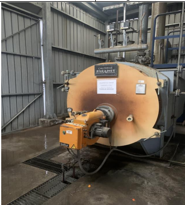
Fotografía 3: Caldera fuera de servicio.

El titular del establecimiento deberá realizar el catastro de las Calderas del establecimiento en el Sistema de Seguimiento Atmosférico SISAT a la brevedad, cuyo ingreso se realiza a través del portal de Ventanilla Única del RETC. Esto de acuerdo con la Resolución Exenta N°2452, de 10 de diciembre de 2020 que aprueba "Protocolo de Conexión en Línea y Reporte de Variables Operacionales para la Verificación de Compromisos Ambientales" de la Superintendencia del Medio Ambiente.