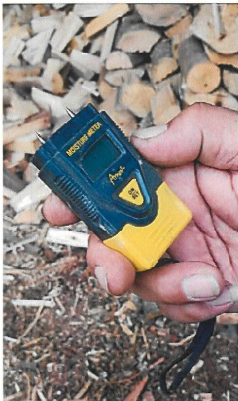
Xilohigrómetro presente en el local