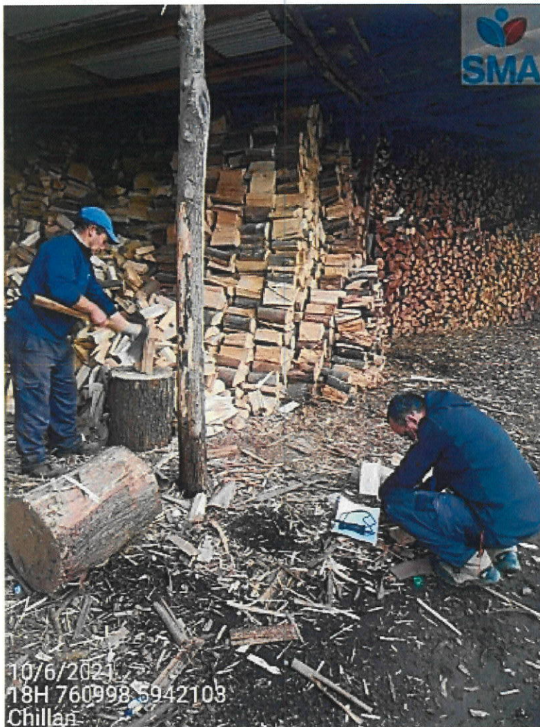
Leña dispuesta para la venta dentro de la propiedad