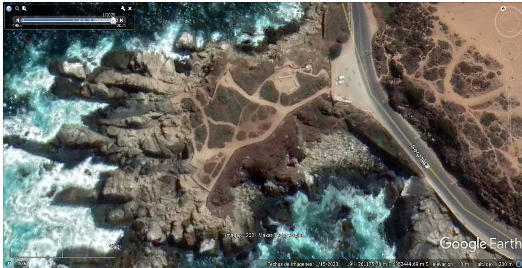
Imagen N° 1.

Descripción del medio de prueba: Detalle de la superficie intervenida del Santuario Roca Oceánica, con posterioridad a la implementación de las obras de mejoras.