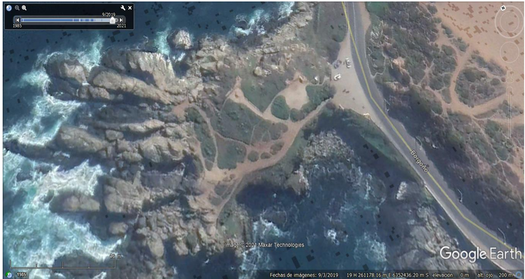
Imagen N° 1.

Descripción del medio de prueba: Detalle de la superficie intervenida del Santuario Roca Oceánica, con anterioridad a la implementación de las obras de mejoras.