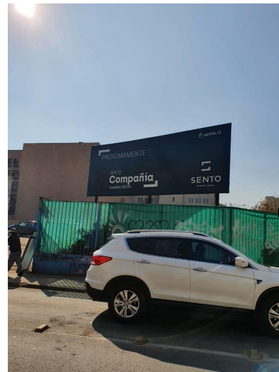
Fotografías tomadas en terreno.