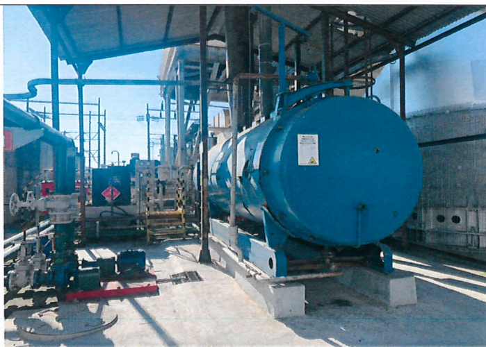
Fotografía 2: Caldera de respaldo.