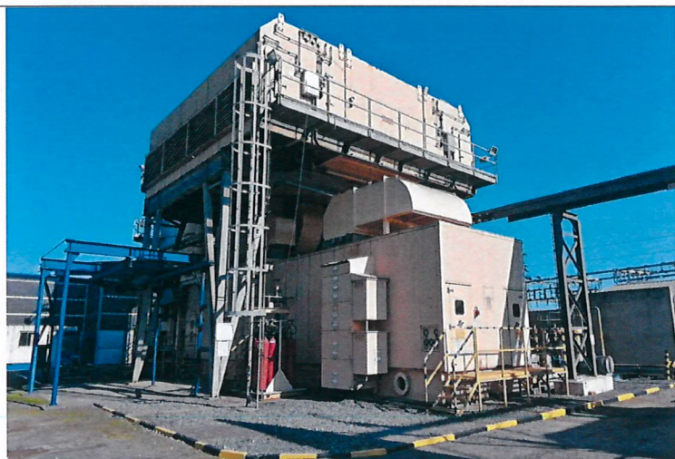
Fotografía 1: Turbina PSEG - Coronel.