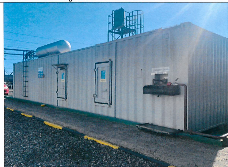
Fotografía N 3. Grupo electrógeno de emergencia de la planta