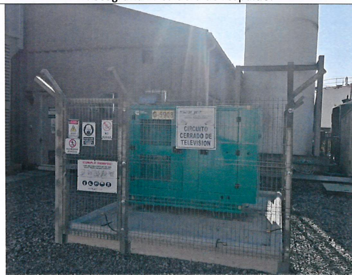
Fotografía 4: Grupo electrógeno de respaldo oficinas.

Cabe señalar que el titular del establecimiento no ha realizado el catastro de la Caldera del establecimiento en el Sistema de Seguimiento Atmosférico SISAT, cuyo ingreso se realiza a través del portal de Ventanilla Única del RETC. Esto de acuerdo con la Resolución Exenta N°2452, de 10 de diciembre de 2020 que aprueba "Protocolo de Conexión en Línea y Reporte de Variables Operacionales para la Verificación de Compromisos Ambientales" de la Superintendencia del Medio Ambiente.