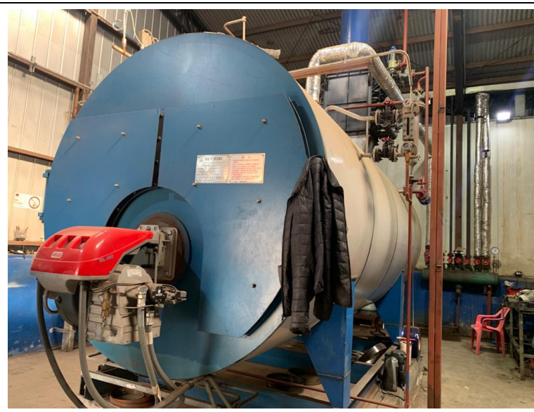
Fotografía N°2 Fecha: 03.05.2021

Descripción: Caldera N°1 Planta Procesadora Martínez y Lagos.