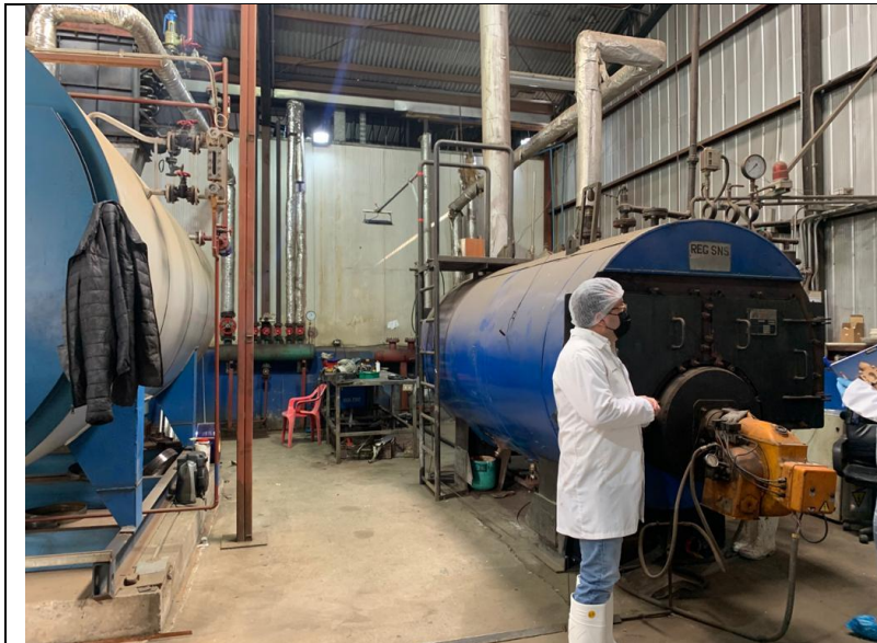
Fotografía N°1 Fecha: 03.05.2021

Descripción: Caldera N°1 Planta Procesadora Martínez y Lagos.