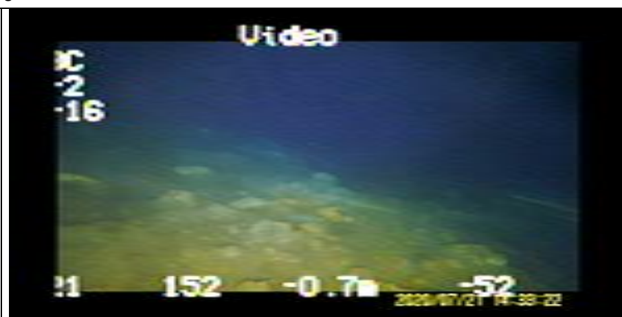
Fotografía 1. Fecha: ---