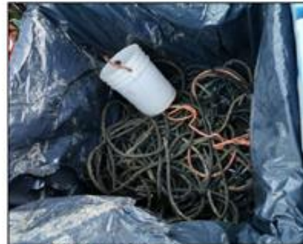
2.- Rollos de cabo.