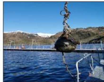
4.- Contrapeso redondo 250 kg.