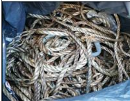
3.- Rollos de cabo.