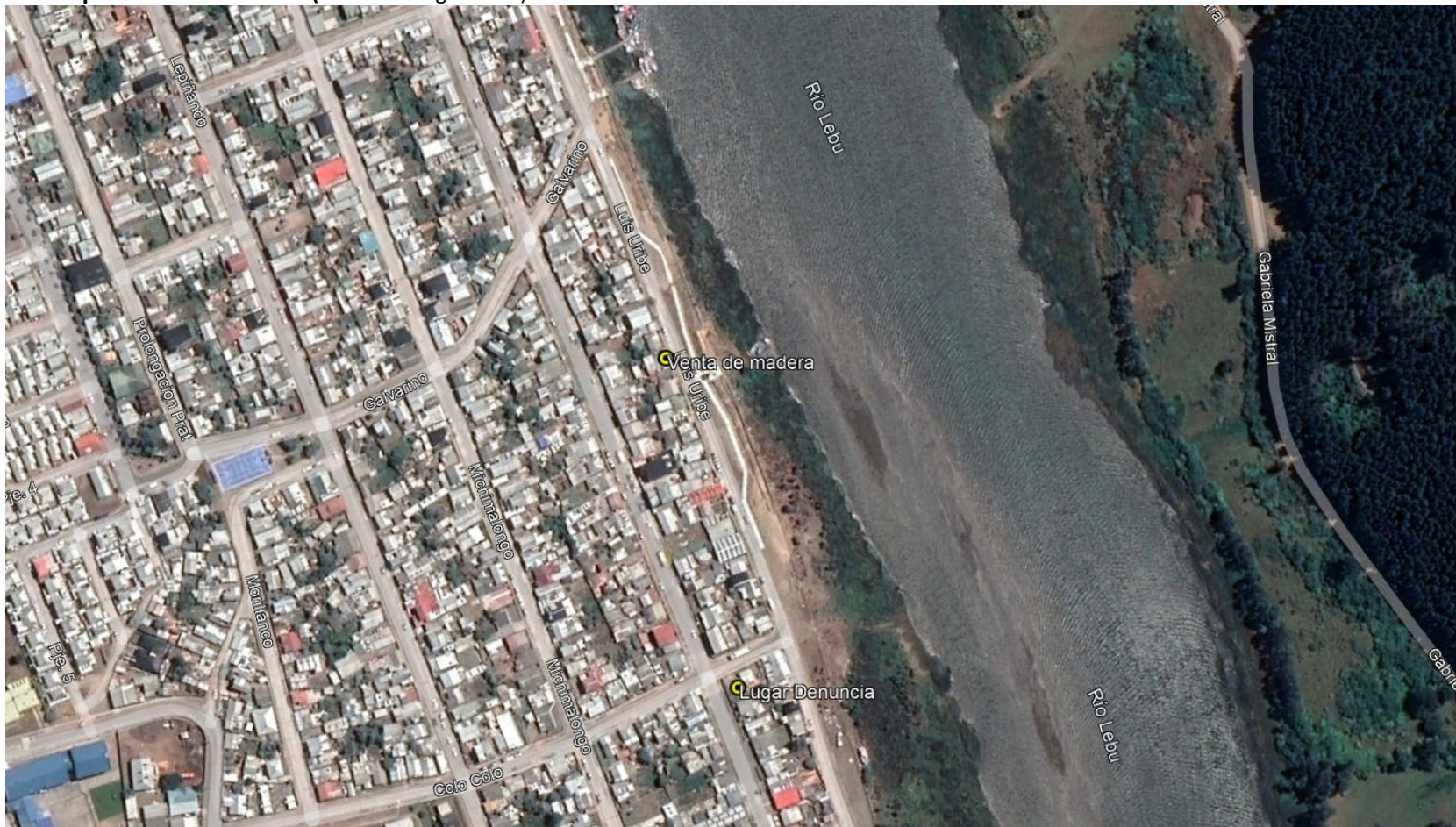
Figura 1. Mapa de ubicación local.

Coordenadas UTM de referencia: DATUM WGS 84