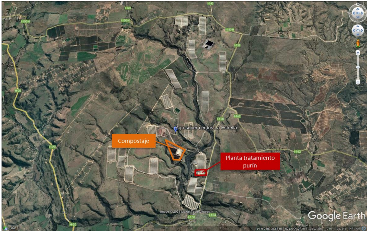
Figura 2. Layout del proyecto (Fuente: Google earth, 2021; elaboración propia).