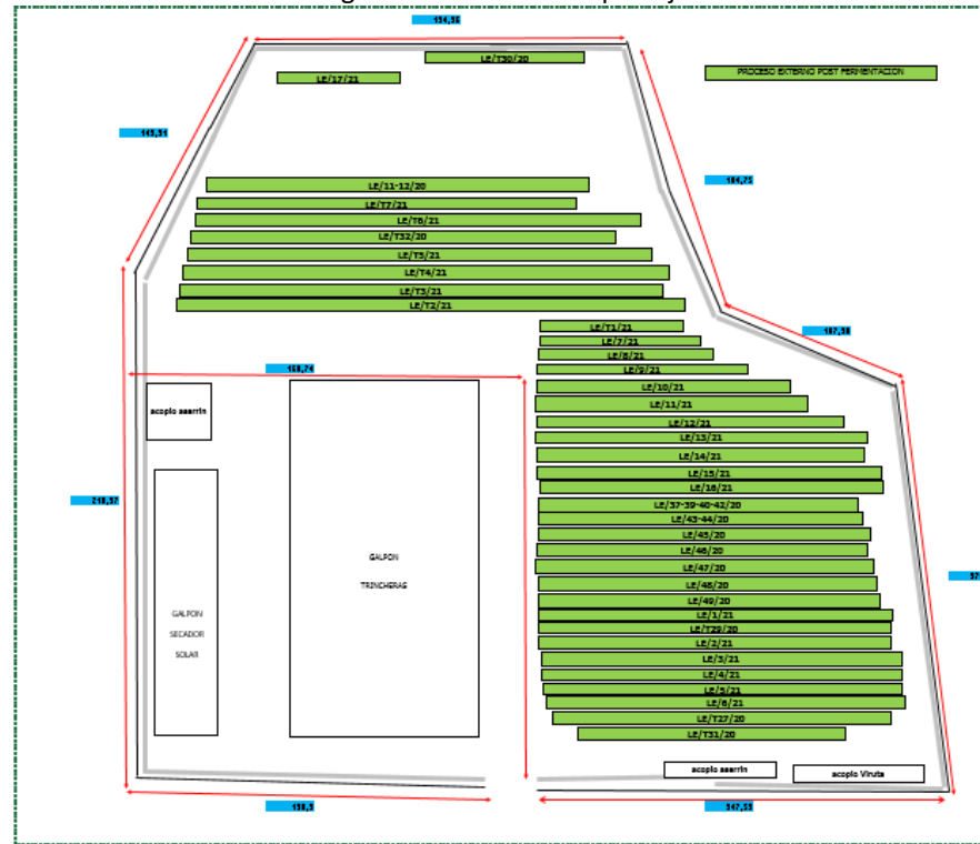
Figura 1: Resumen compostaje

El examen de información realizado por el SAG a los informes de seguimiento reportados por el titular en el Sistema de reporte de esta Superintendencia contenido en reporte técnico N° 1205 y derivado mediante ORD SAG N° 1102/2021 (anexo 5) respecto a los despachos de bioestabilizado durante el periodo desde 2014 al 2020, indica lo siguiente: