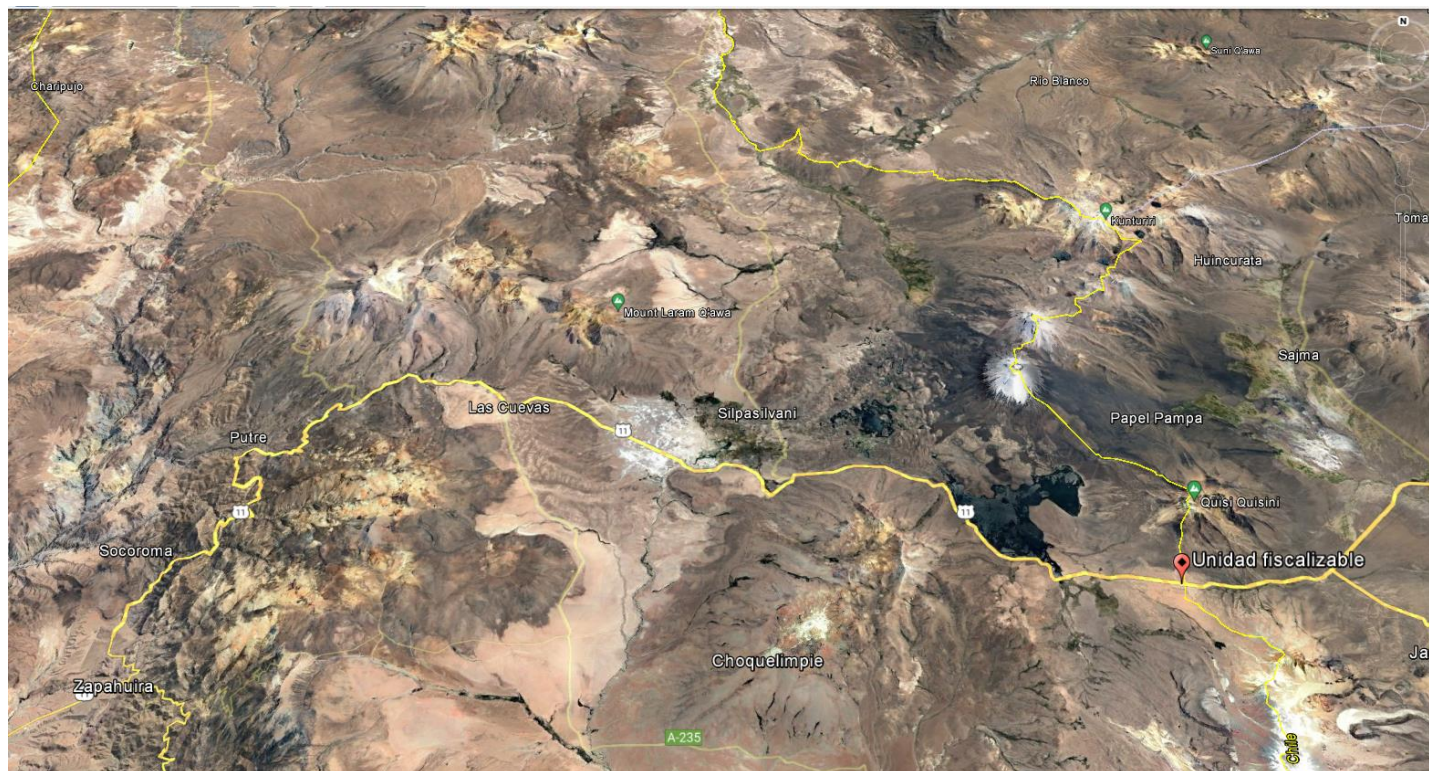
Figura 1. Mapa de ubicación local

Coordenadas UTM de referencia: DATUM WGS 84