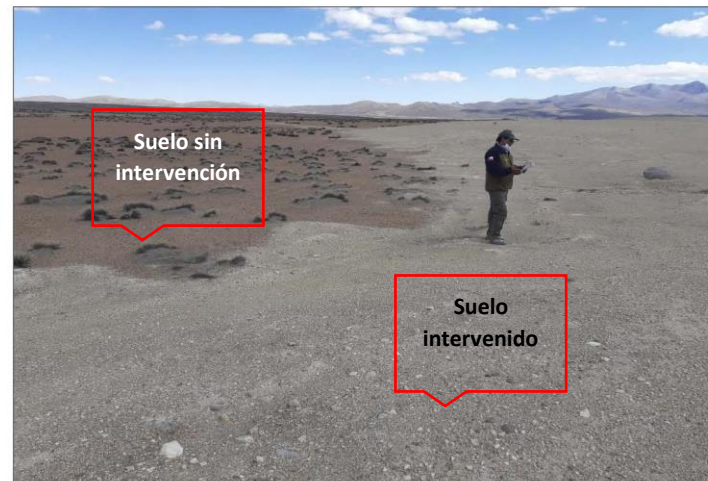
Fotografía 7.