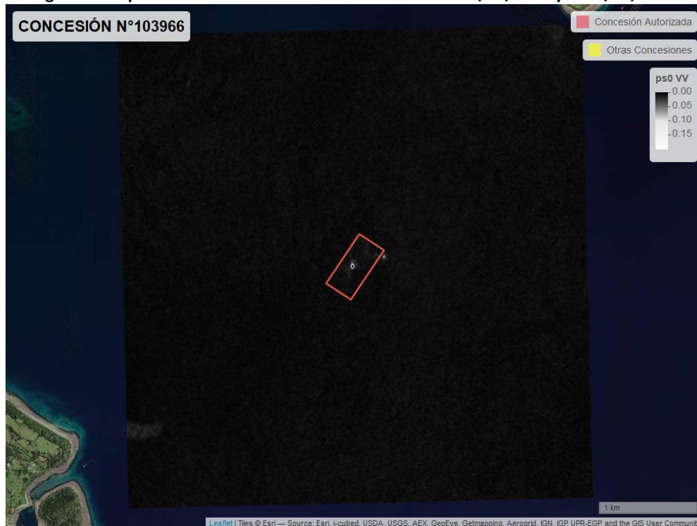
Figura 2. Mapa resultados monitoreo realizado entre el 01/02/2021 y el 31/03/2021

En las siguientes figuras se muestran las imágenes analizadas para cada periodo: