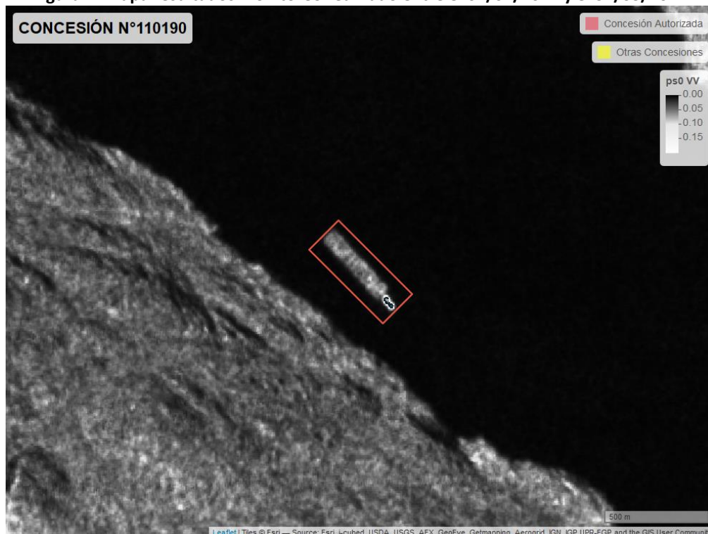
Figura 2. Mapa resultados monitoreo realizado entre el 01/02/2021 y el 31/03/2021

En las siguientes figuras se muestran las imágenes analizadas para cada periodo: