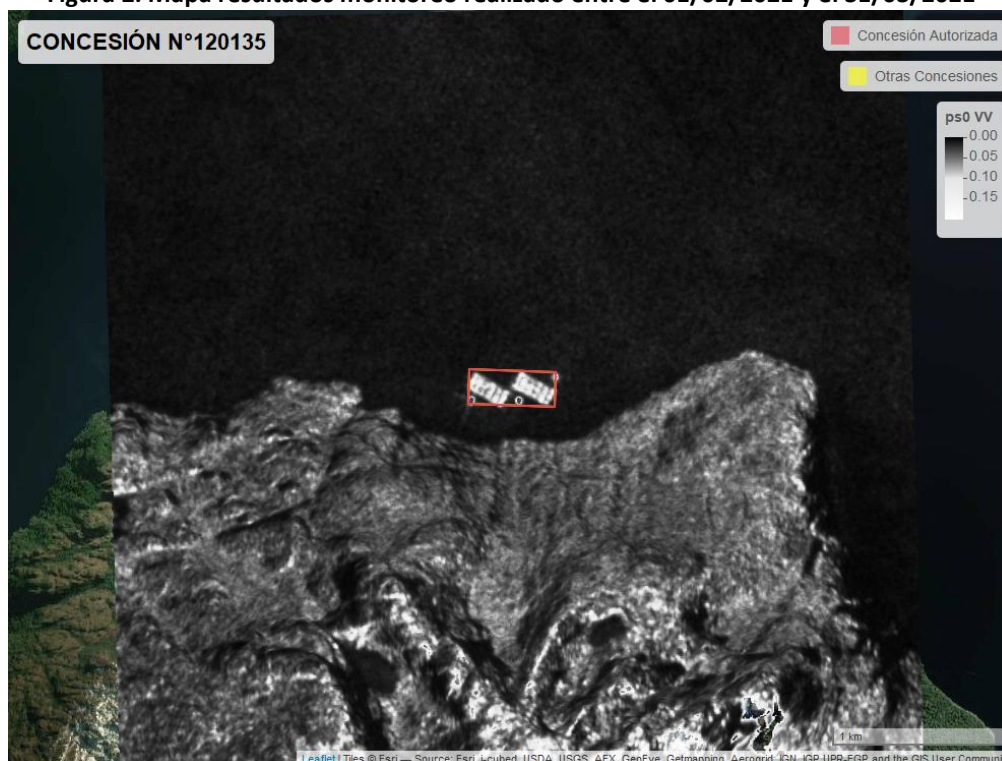
Figura 2. Mapa resultados monitoreo realizado entre el 01/02/2021 y el 31/03/2021

En las siguientes figuras se muestran las imágenes analizadas para cada periodo: