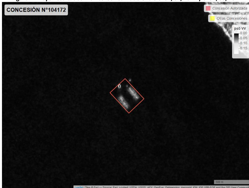
Figura 2. Mapa resultados monitoreo realizado entre el 01/02/2021 y el 31/03/2021

En las siguientes figuras se muestran las imágenes analizadas para cada periodo: