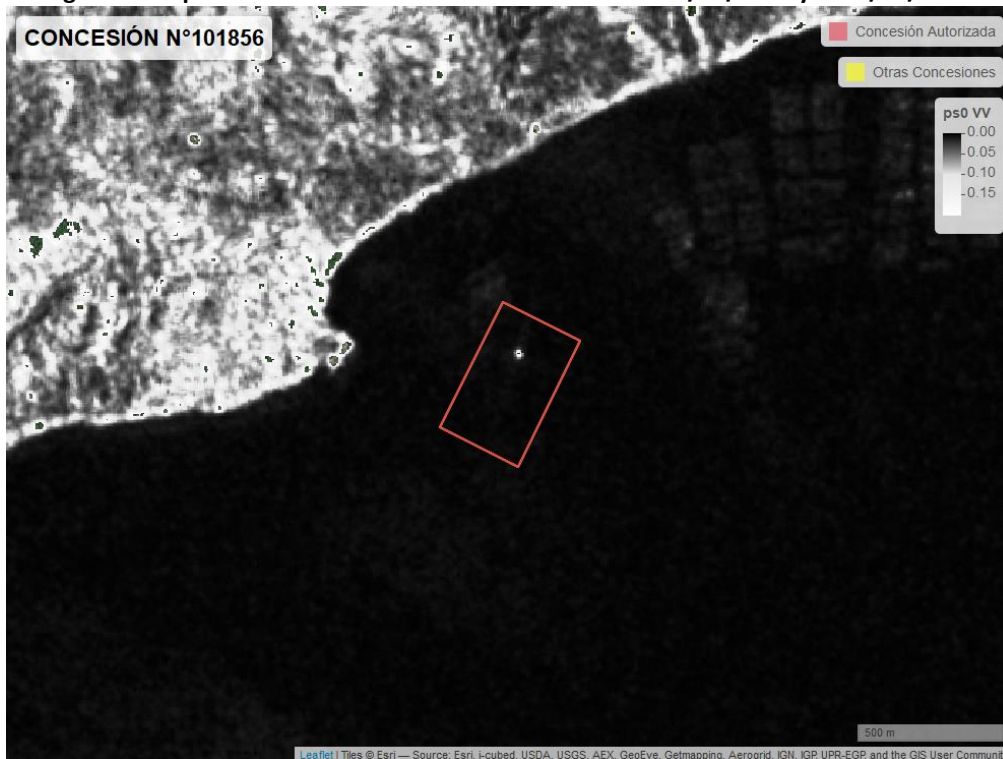
Figura 2. Mapa resultados monitoreo realizado entre el 01/02/2021 y el 31/03/2021

En las siguientes figuras se muestran las imágenes analizadas para cada periodo: