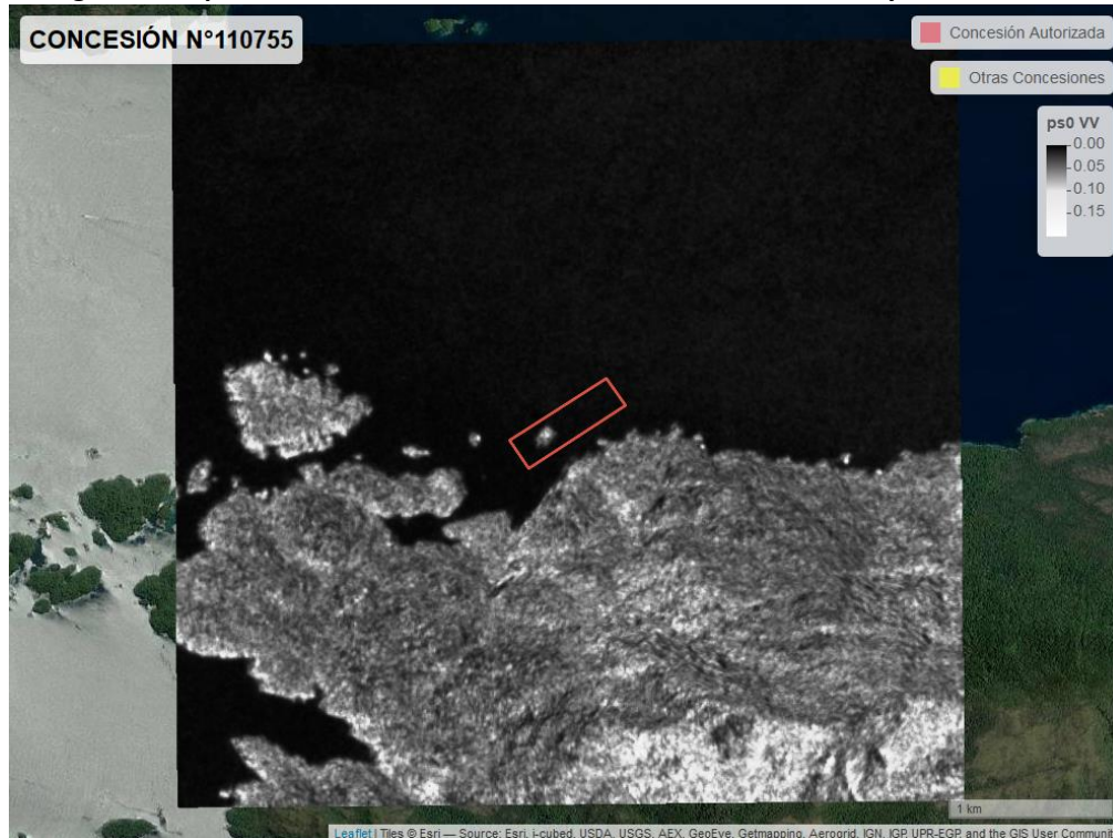
Figura 2. Mapa resultados monitoreo realizado entre el 01/02/2021 y el 31/03/2021

En las siguientes figuras se muestran las imágenes analizadas para cada periodo: