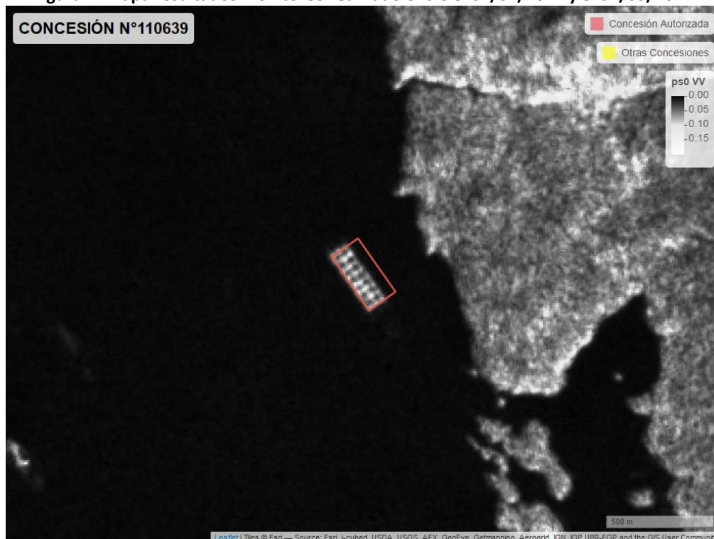
Figura 2. Mapa resultados monitoreo realizado entre el 01/02/2021 y el 31/03/2021

En las siguientes figuras se muestran las imágenes analizadas para cada periodo: